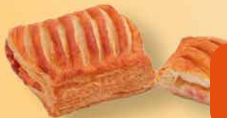
24B267 - 81872 CRESTA FRANKFURT Y QUESO 100GR 60 UND 1X1