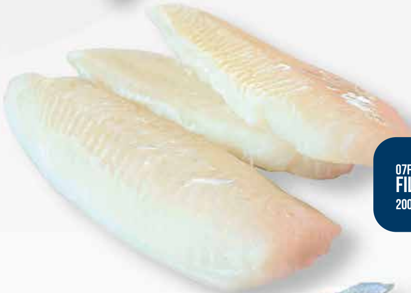
07F72 FILETE HALIBUT 200/400 25% GL. 1X6 KG