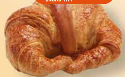
24B263 - 69405 CROISSANT MARGARINA CURVO XL 120GR 34UND 1X1