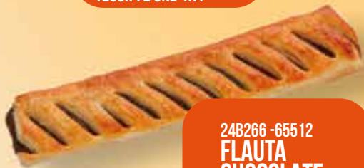
24B266 - 65512 FLAUTA CHOCOLATE 75GR 100 UND 1X1