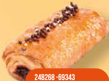
24B268 - 69343 SUPER NAPOLITANA BOMBON FACIL 120GR 72 UND 1X1