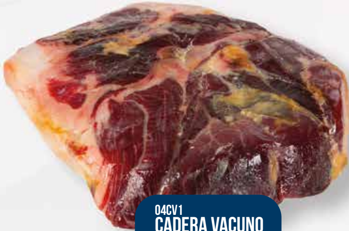
04CV1 CADERA VACUNO MAYOR (CROCA) CONGELADA 1X5,5KG APROX.

04H70 HAMBURGUESA VACUNO 200GR 1X20 UD DEHESA BEEF