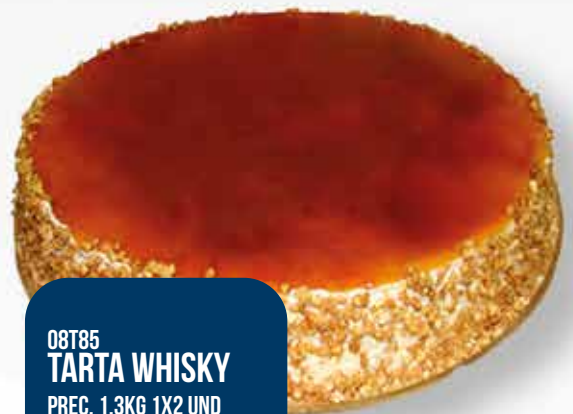
08T85 TARTA WHISKY PREC. 1,3KG 1X2 UND