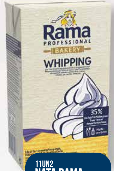
11UN2 NATA RAMA PROFESIONAL 35% MG.G 1X8L./UND