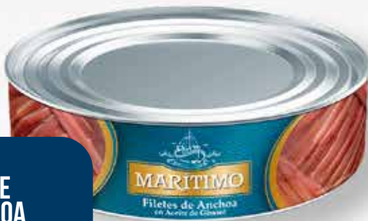
10FA5 FILETE ANCHOA R0-1000 16X UND