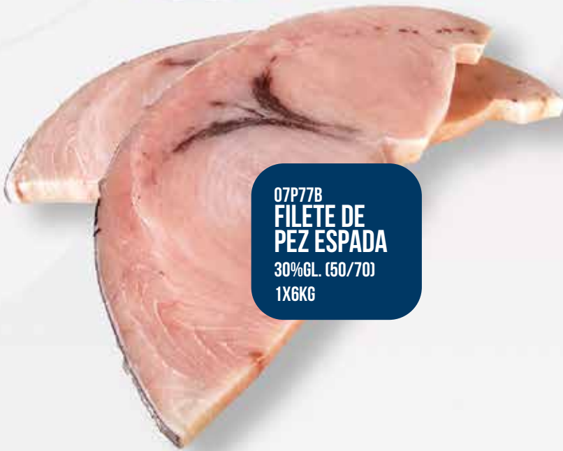
07P77B FILETE DE PEZ ESPADA 30%GL. (50/70) 1X6KG