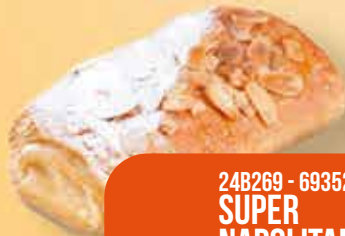
24B269 - 69352 SUPER NAPOLITANA CREMA FACIL 120GR 72 UND 1X1