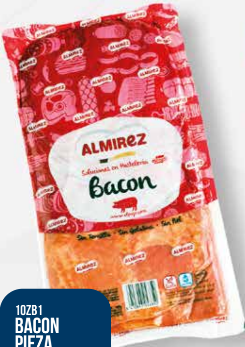
10ZB1 BACON PIEZA ALMIREZ 2X3.2 KG APROX