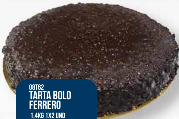
08T62 TARTA BOLO FERRERO 1,4KG 1X2 UND