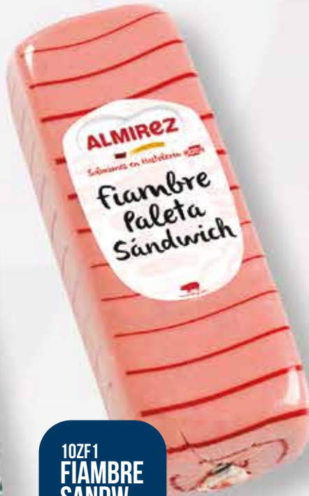
10ZF1 FIAMBRE SANDW. ALMIREZ 2X4 KG