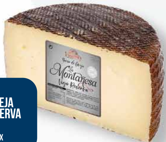
0008B QUESO OVEJA VIEJO RESERVA MITAD 4X1,6 KG APROX