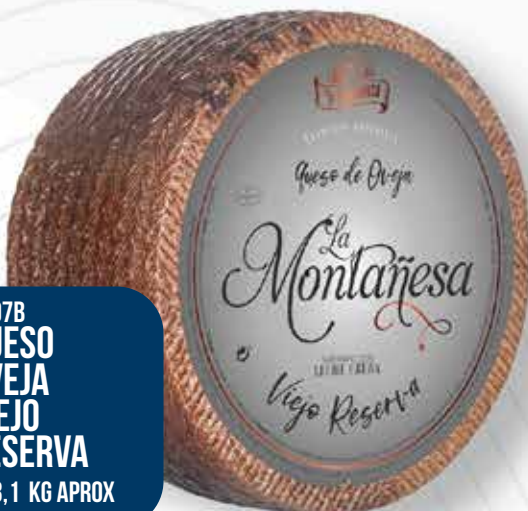
0007B QUESO OVEJA VIEJO RESERVA 2X3,1 KG APROX