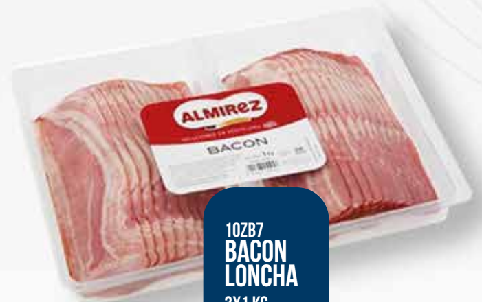
10ZB7 BACON LONCHA 3X1 KG