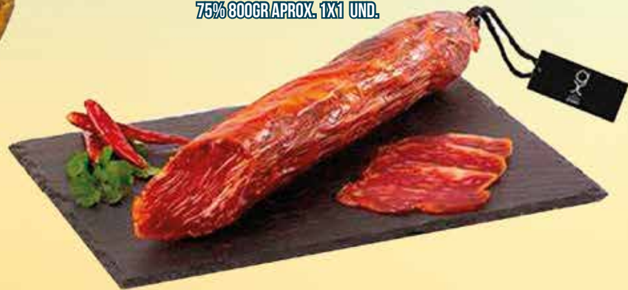
10L16 LOMO BELLOTA 75% 75% 800GR APROX. 1X1 UND.