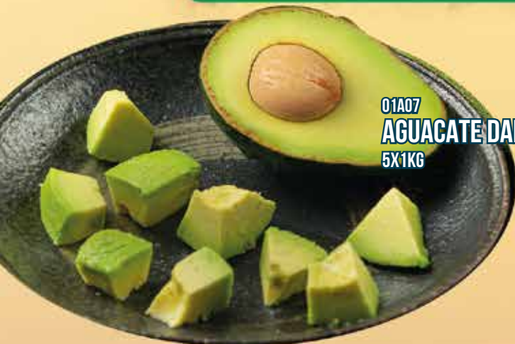
01A07 AGUACATE DADOS 5X1KG