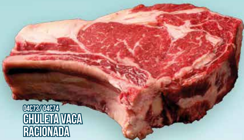
04C73/04C74 CHULETA VACA RACIONADA 500GR/1KG