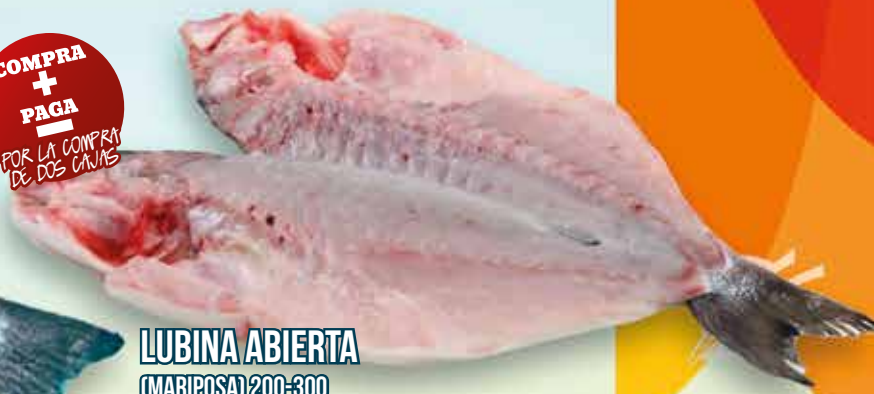
LUBINA ABIERTA (MARIPOSA) 200-300 1X5KG

COMPRA + PAGA POR LA COMPRA DE DOS CAJAS