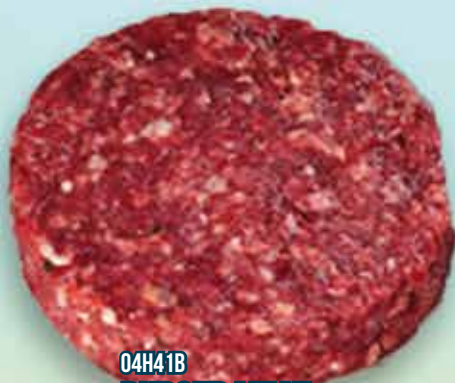
04H41B BURGER MEAT 100% VAGUNO 180GR 1X30UND