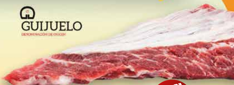
04P24 PLUMILLA ALJOMAR CERDO IBÉRICO (1,2KG APROX./3 PZAS) 1X9,6KG APROX

COMPRA + PAGA POR LA COMPRA DE DOS CAJONES