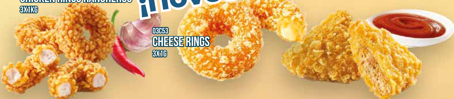
03C53 CHEESE RINGS 3X1G