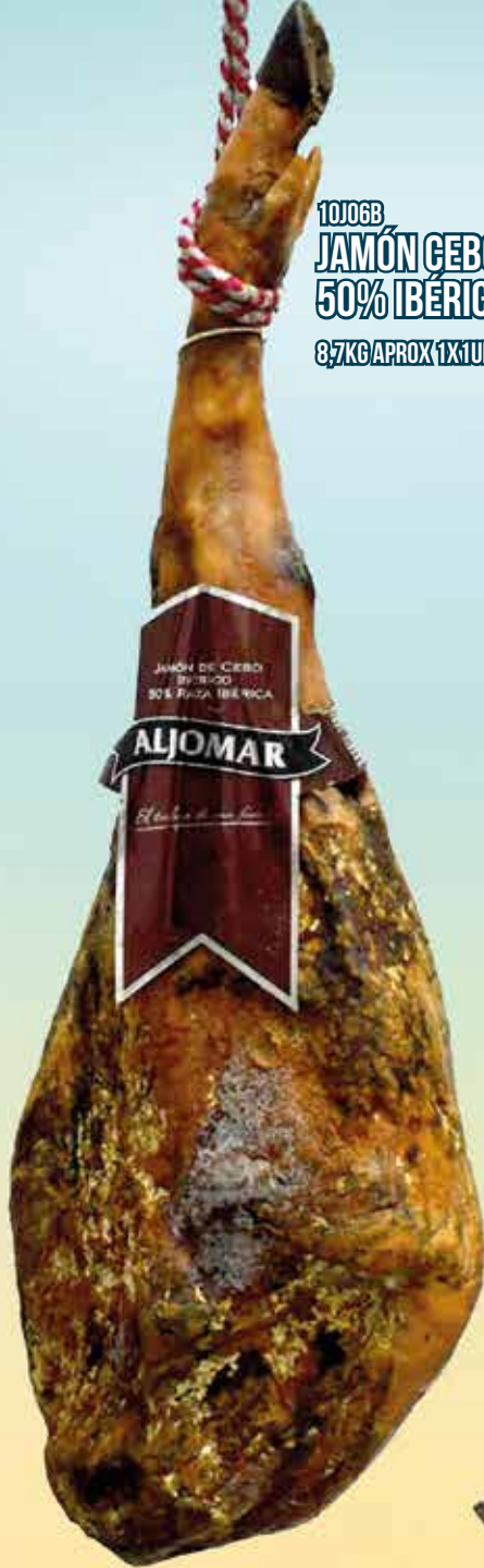
10J06B JAMÓN CEBO 50% IBÉRICO 8,7KG APROX 1X1UND