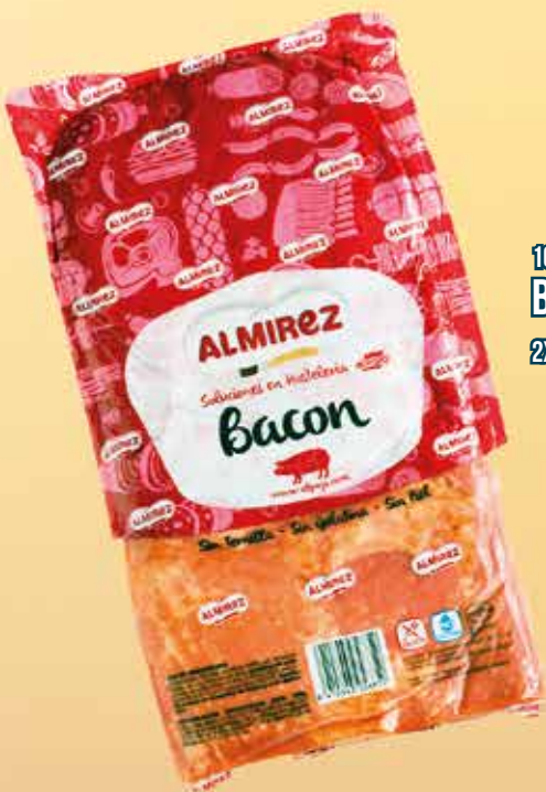
10ZB1 BACON PIEZA 2X3,2KG APROX.