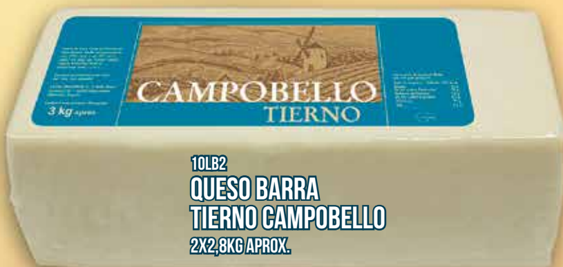
10LB2 QUESO BARRA TIERNO CAMPOBELLO 2X2,8KG APROX.