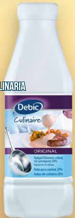
10CN2B NATA CULINARIA DEBIC 1L 1X6 UND.