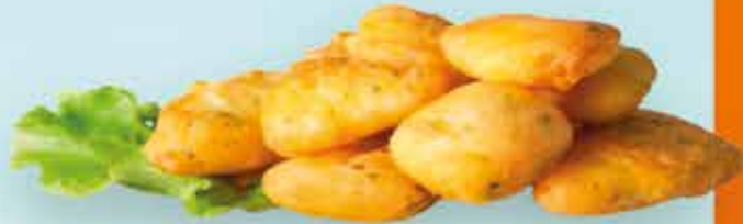
03S22 POTÓN (SEPIA) REBOZADO 5X1KG