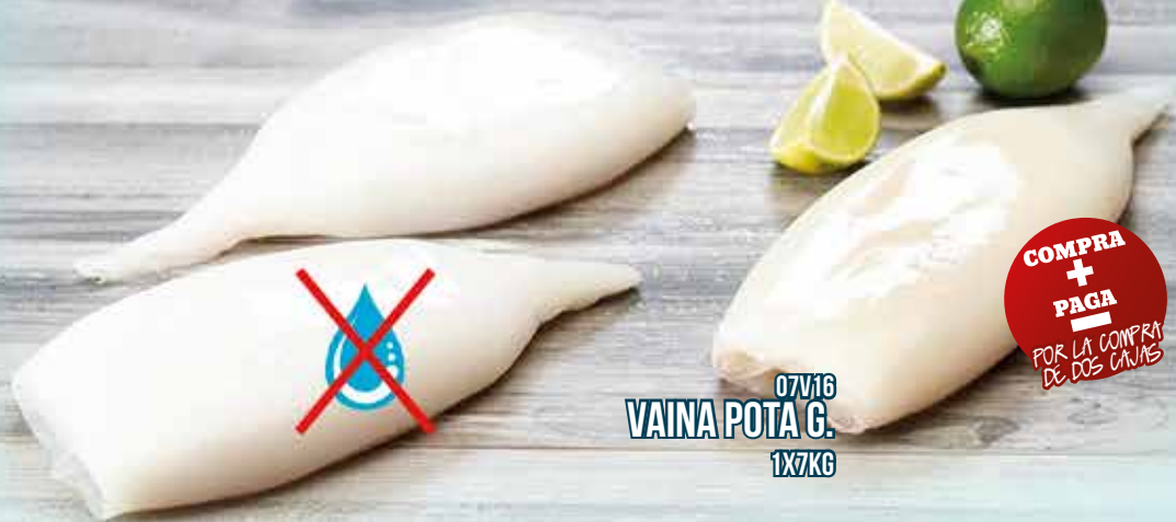
07V16 VAINA POTÁ G. 1X7KG

COMPRA + PAGA POR LA COMPRA DE DOS CAJAS