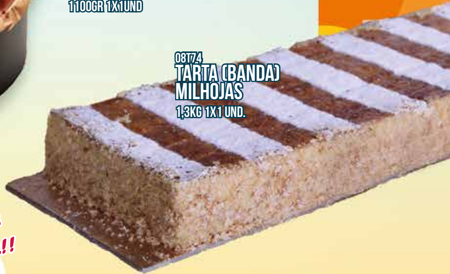
08T74 TARTA (BANDA) MILHOJAS 1,3KG 1X1 UND.