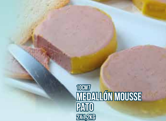
10CM7 MEDALLÓN MOUSSE PATO 2X1,2KG