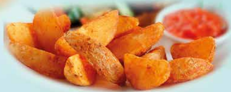
01P38 PATATA GAJO ESPECIADA C/PIEL 4X2,5KG