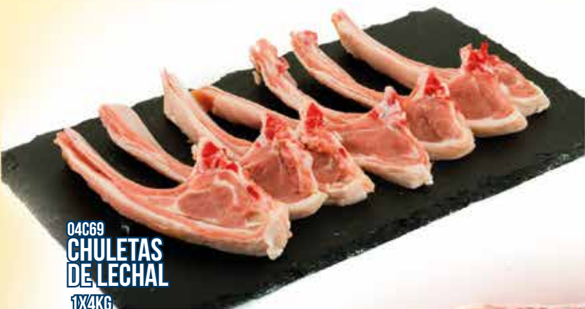
04C69 CHULETAS DE LECHAL 1X4KG

COMPRA + PAGA POR LA COMPRA DE DOS CAJONES