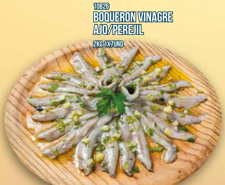
10B26 BOQUERON VINAGRE AJO/PEREJIL 2KG 1X7UND