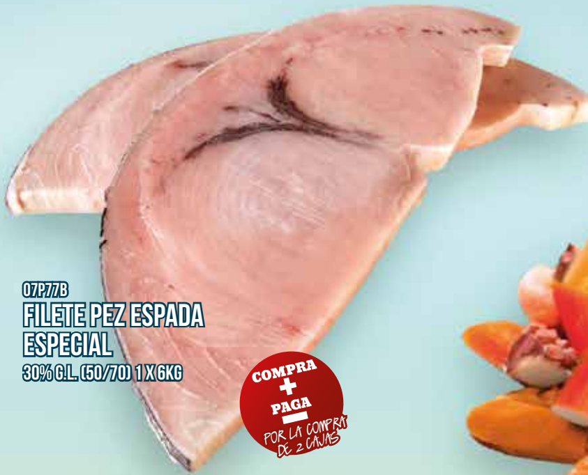
07P77B FILETE PEZ ESPADA ESPECIAL 30% G.L. (50/70) 1X6KG

COMPRA + PAGA — POR LA COMPRA DE 2 CAJAS