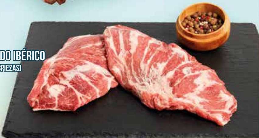
04P28 PRESA CERDO IBÉRICO (1,1KG APROX/8 PIEZAS)