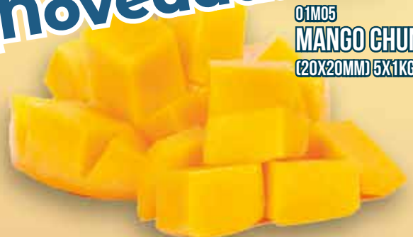
01M05 MANGO CHUNKS (20X20MM) 5X1KG