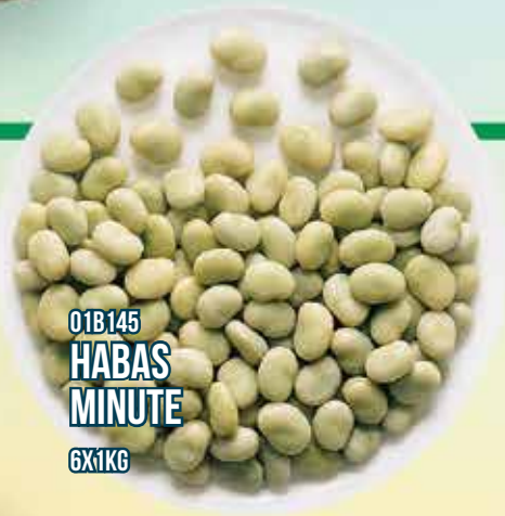
01B145 HABAS MINUTE 6X1KG