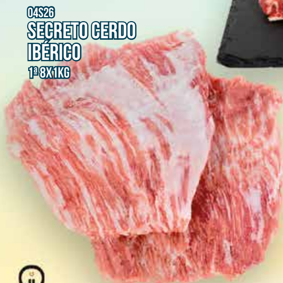
04S26 SECRETO CERDO IBÉRICO 1º 8X1KG