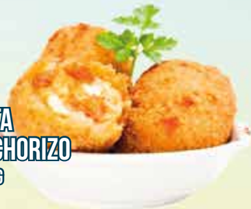
03C112 GROQUETA HUEVO/CHORIZO (35GR) 5X1KG