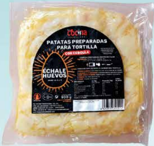
10P01 PREPARADO DE TORTILLA C/CEBOLLA 8X900GR UD.