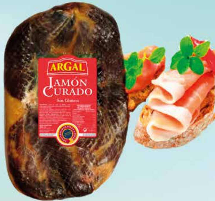
10C22 CENTRO JAMON MAX RDTO. ARGAL 2X4KG APROX