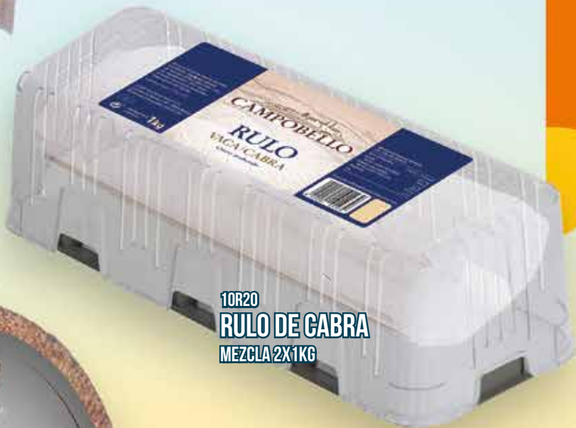
10R20 RULO DE CABRA MEZCLA 2X1KG