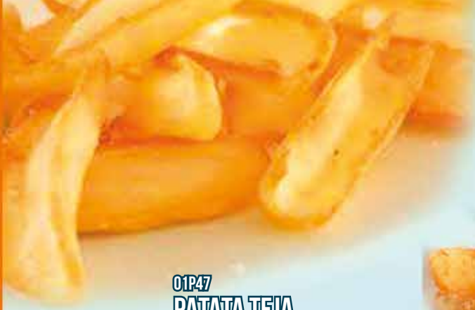
01P47 PATATA TEJA 5X2KG