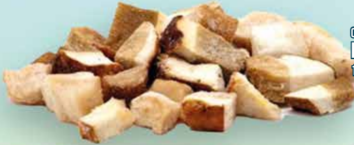
01B15 BOLETUS TROCEADOS 11GR 4X1KG