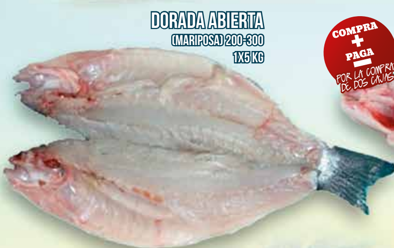
DORADA ABIERTA (MARIPOSA) 200-300 1X5KG

COMPRA + PAGA POR LA COMPRA DE DOS CAJAS