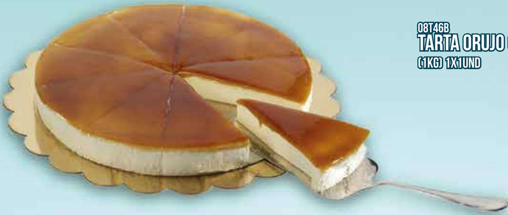
08T46B TARTA ORUJO GALLEGO (1KG) 1X1UND