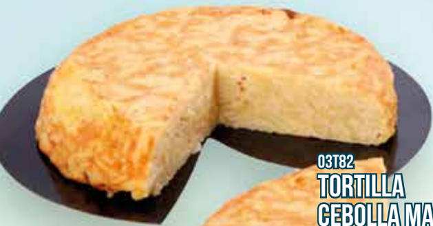
03T82 TORTILLA CEBOLLA MAXI (1,5KG) 1X6UND