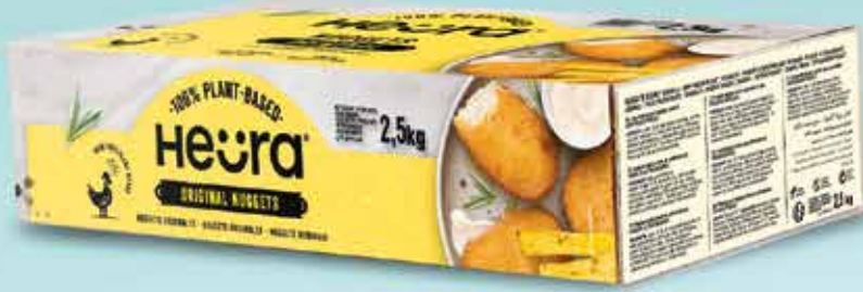
03N70 NUGGETS ORIGINAL (125 UND) 1X2,5KG HEURA