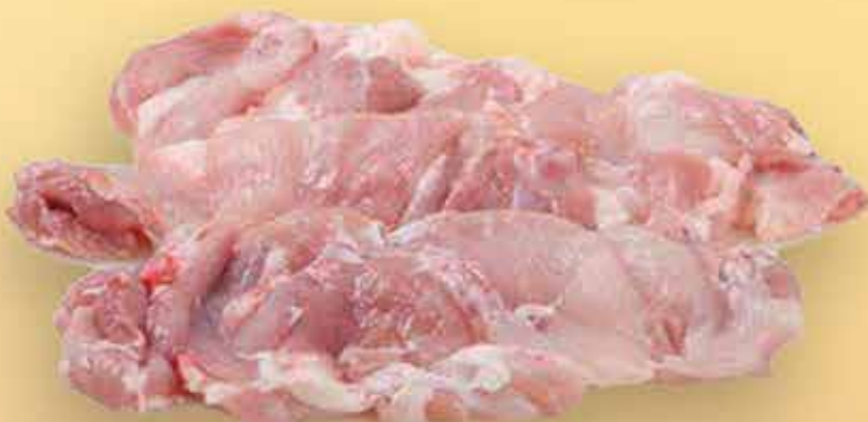
04FD5 FILETE CONTRAMUSLO INTERF. 1X5KG